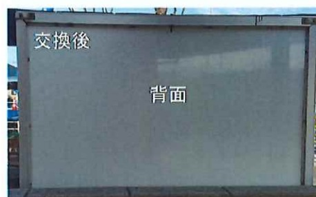
ブックオフ付近(11地区)